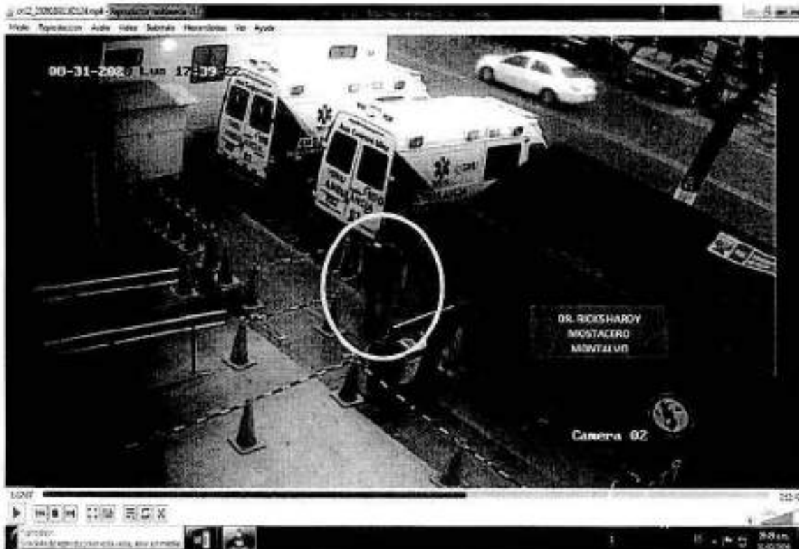
IMAGEN N° 02

iii) El video Ch 11_ 20200831173552.mp4, captado por la cámara n° 11 ubicada en la parte interior de la puerta principal del HEJCU, donde se aprecia al servidor RICKS HARDY MOSTACERO MONTALVO ingresando al HEJCU entre 17 (horas) 39 (minutos) (29 segundos), conforme se aprecia en la imagen n° 03.