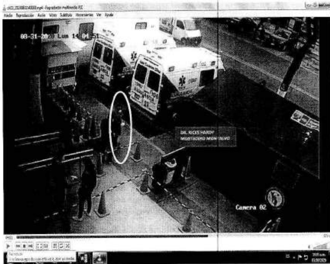
IMAGEN N° 01

i) El video Ch 02_ 20200831140000.mp4, captado por la cámara n° 02 ubicada en la parte externa de la puerta principal del HEJCU, donde se aprecia al servidor RICKS HARDY MOSTACERO MONTALVO y otros galenos saliendo entre 14 (horas) 04 (minutos) (48-55 segundos) del citado nosocomio con dirección desconocida, conforme se aprecia en la imagen n° 01.