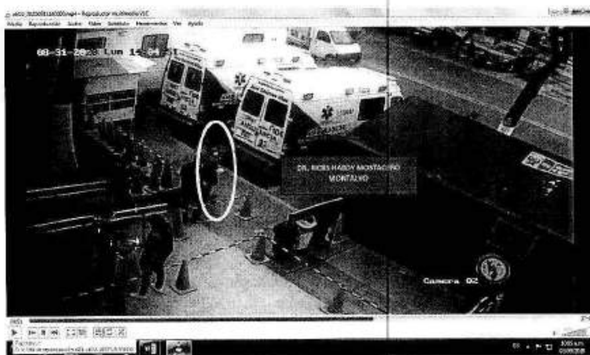
IMAGEN N° 01

vii) El video Ch 02_ 20200831140000.mp4, captado por la cámara n° 02 ubicada en la parte externa de la puerta principal del HEJCU, donde se aprecia al servidor RICKS HARDY MOSTACERO MONTALVO y otros galenos saliendo entre 14 (horas) 04 (minutos) (48-55 segundos) del citado nosocomio con dirección desconocida, conforme se aprecia en la imagen n° 01.