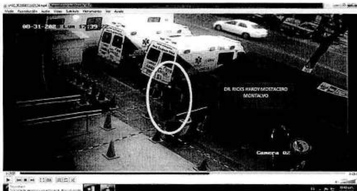
IMAGEN N° 02

vii) El video Ch 02_ 20200831140000.mp4, captado por la cámara n° 02 ubicada en la parte externa de la puerta principal del HEJCU, en la cual se aprecia al servidor RICKS HARDY MOSTACERO MONTALVO ingresando al HEJCU entre 17 (horas) 39 (minutos) (22 segundos), conforme se aprecia en la imagen n° 02.